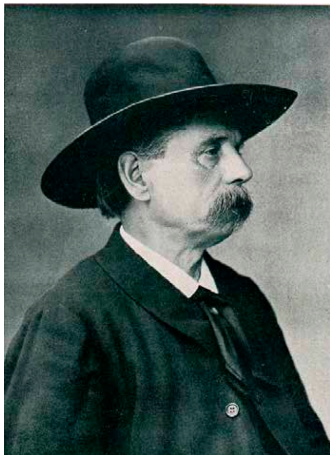
JEAN-BAPTISTE CLÉMENT PAR NADAR.

AYANT PU SE RÉFUGIER À LONDRES, JEAN-BAPTISTE CLÉMENT DEVAIT MILITER, APRÈS SON RETOUR EN FRANCE À LA SUITE DE L'AMNISTIE DE 1880, AU SEIN DU PARTI OUVRIER SOCIALISTE RÉVOLUTIONNAIRE DE PAUL BROUSSE, REJOIGNANT ENSUITE LE PARTI OUVRIER FRANÇAIS DE JULES GUESDE.