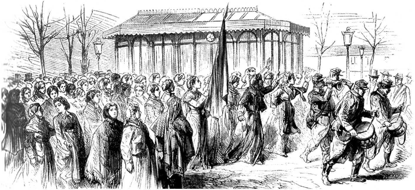
MANIFESTATION DES FEMMES, PLACE DE LA CONCORDE LE 3 AVRIL 1871, RÉCLAMANT UNE MARCHÉ SUR VERSAILLES.

poser des questions différentes. On leur demande toujours, par exemple, si elles ont combattu parce qu'elles étaient amoureuses d'un homme. Impossible d'imaginer qu'elles aient pu se battre parce qu'elles en avaient envie. « Quelle était votre relation » sous-entendue sexuelle, « avec tel ou tel communard ? » etc. S'agissant des punitions prononcées par les conseils de guerre, la peine de mort reste une exception pour les femmes, et les rares peines capitales prononcées à leur encontre ont été commuées en travaux forcés. D'autre part, ce qui n'apparaît pas dans les archives des procès et qui est pourtant très présent dans la manière dont la population les voit, c'est la légende des « pétroleuses » : elles auraient provoqué les incendies à Paris, alors qu'aucune n'est inculpée pour ça.