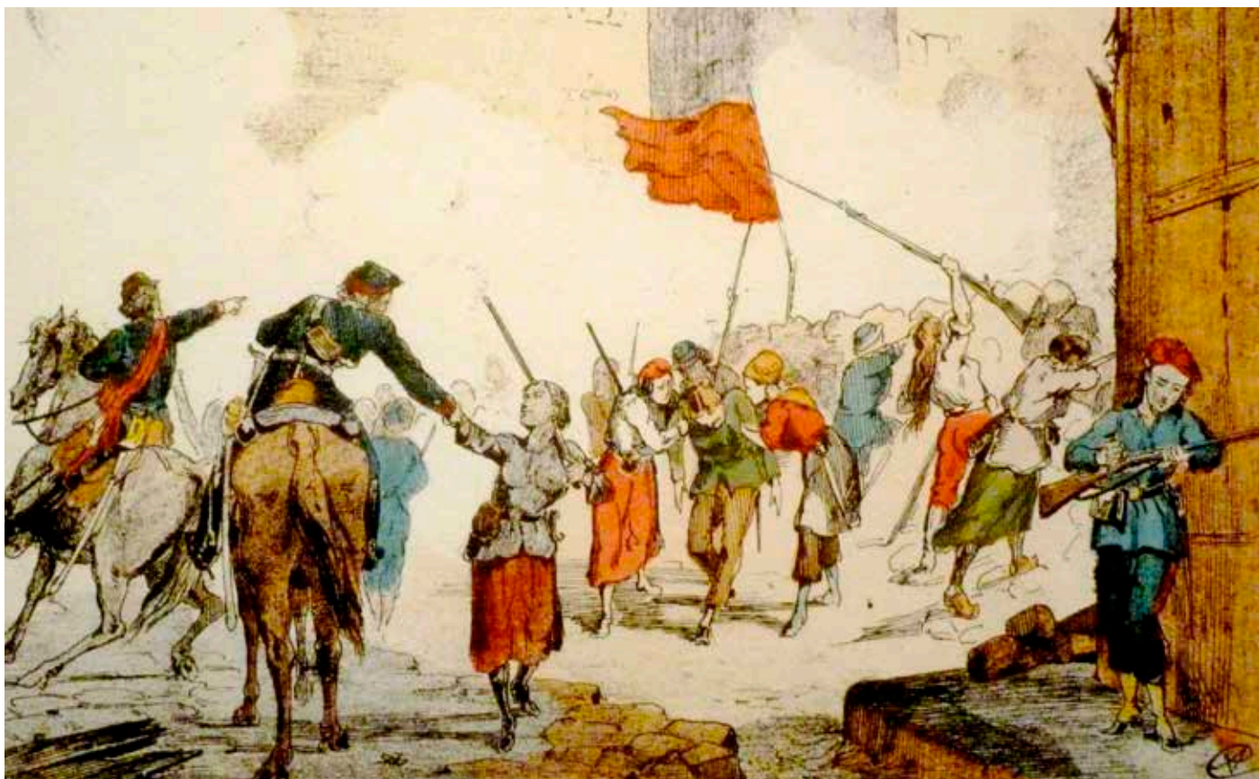
LA BARRICADE DE LA PLACE BLANCHE DÉFENDUE PAR DES FEMMES.

G.P. : Qu'obtiennent-elles concrètement ?