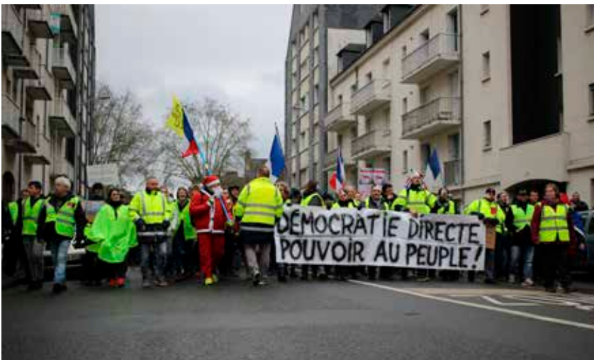
TOURS, LE 2 FÉVRIER 2019.

LES ASSEMBLÉES ET LES DÉBATS SE POURSUIVENT DANS LES COLLECTIFS GILETS JAUNES. LE COLLECTIF ENSEIGNEMENT-RECHERCHE ET LES GRANDS VOISINS ORGANISAIT EN JUIN DERNIER UN DÉBAT SUR LA DÉMOCRATIE RÉELLE.